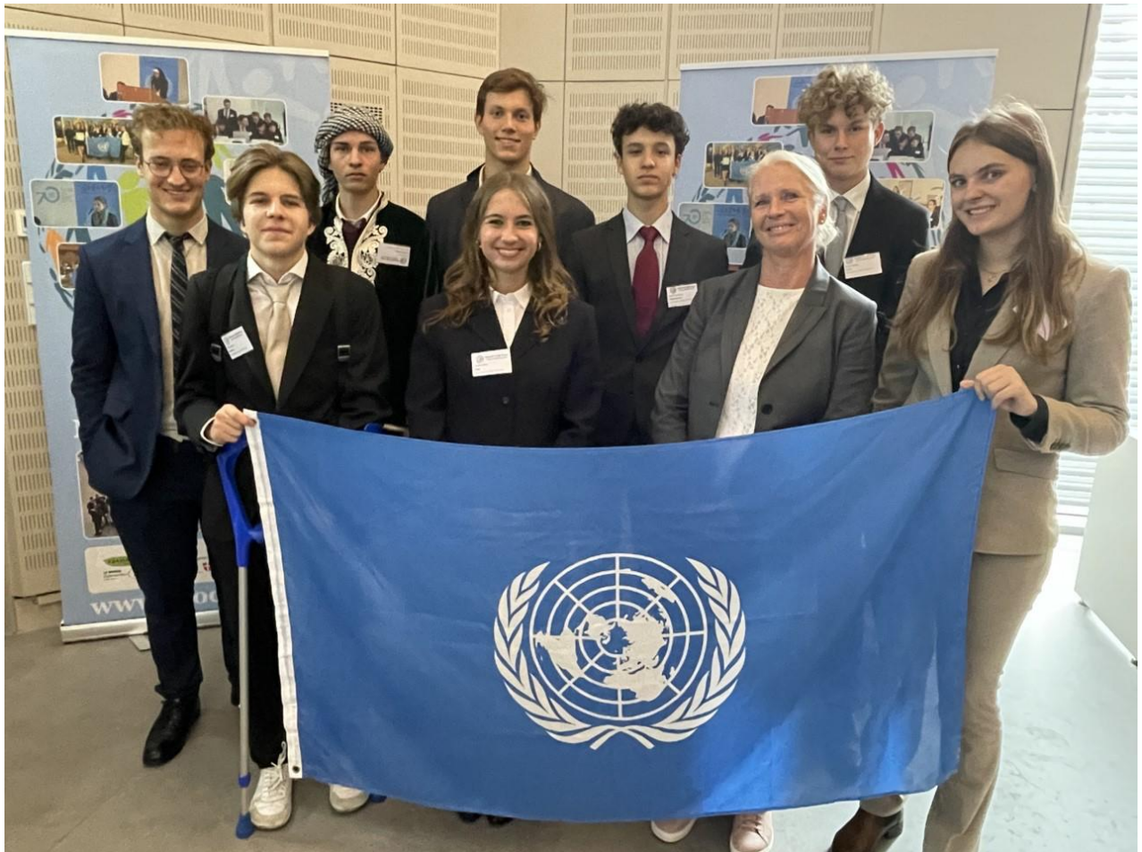
Die Delegierten des Schulschiffs