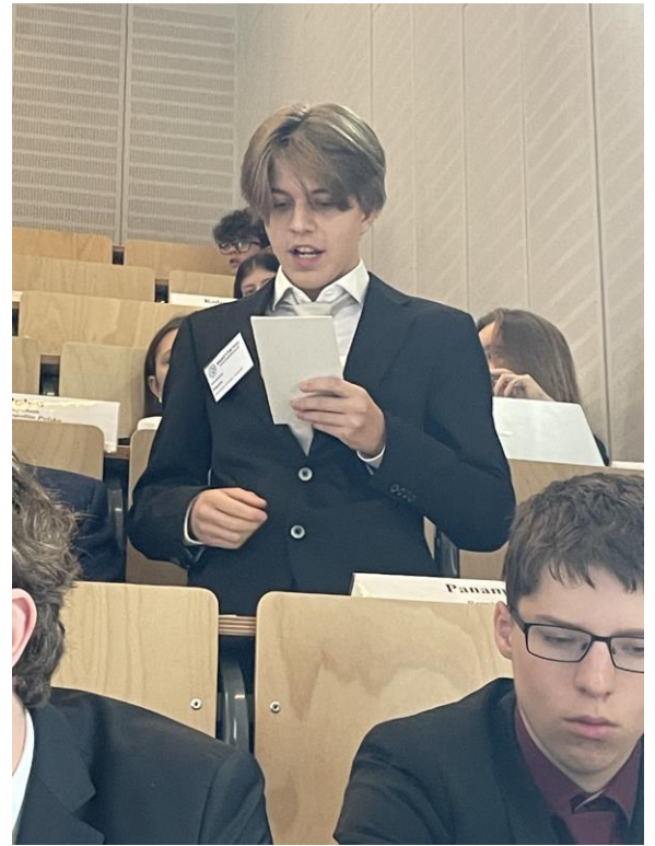
Beim Stellen und Beantworten der kritischen Fragen