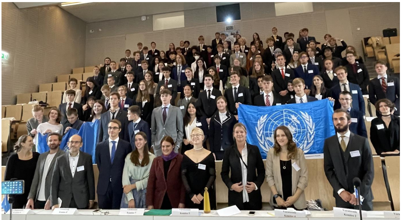
Die Delegierten der Modell-UNO 2022!